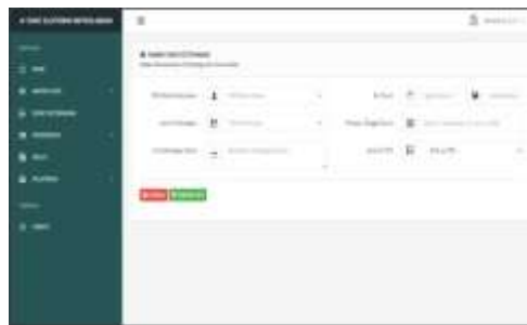
Gambar 11 Tampilan Surat Keterangan

Pada Tampilan ini akan menampilkan form yang berisi pilih nama karyawan, nomor surat, jenis keterangan, isi keterangan surat dan pilih tanda tangan. Jika sudah diisi, pilih tombol save untuk membuat surat dan menyimpannya dalam database.