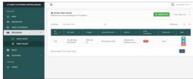
Gambar 7 Tampilan Surat Keluar Pegawai

mencari data surat keluar yang diinginkan.