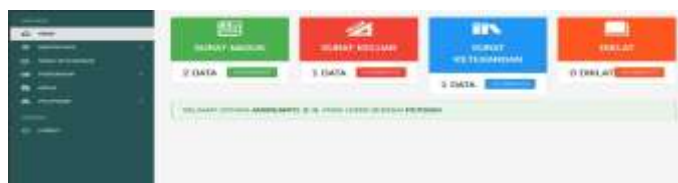
Gambar 4 Tampilan Beranda Pegawai

Gambar 1.4 merupakan tampilan dari beranda pegawai yang akan terlihat apabila login menggunakan username dan password akun user.