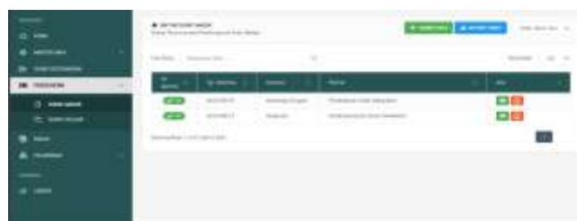
Gambar 6 Tampilan Surat Masuk Pegawai

Pada tampilan ini akan menampilkan data surat masuk yang telah dibuat dalam bentuk tabel yang berisi nomor agenda, tanggal diterima, instansi, perihal dan juga aksi untuk surat yang masuk. Tampilan ini juga terdapat tombol untuk tambah data baru, tombol untuk melihat Riwayat surat yang masuk dan kolom pencarian untuk mencari surat yang diinginkan.