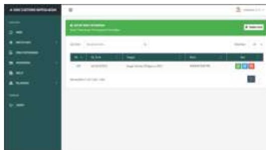
Gambar 8 Tampilan Surat Keterangan Pegawai

Pada tampilan ini akan menampilkan data surat keterangan yang sudah dibuat oleh user dalam bentuk user yang berisi nomor urut, nomor surat, tanggal dibuat, nama yang membuat dan aksi terhadap data surat keterangan. Pada tampilan ini juga tombol tambah data keterangan user untuk membuat surat keterangan dan kolom pencarian untuk menemukan data surat keterangan yang diinginkan.