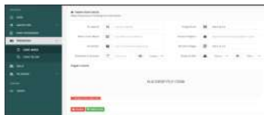
Gambar 9 Tampilan surat masuk

Pada tampilan ini akan menampilkan form yang berisi nomor agenda, nomor surat, tanggal surat, instansi pengirim, tanggal terima surat, perihal, lampiran, sifat surat dan unggah file surat. Jika sudah diisi pilih tombol save untuk menyimpan data surat masuk tadi kedalam database.