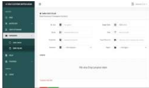
Gambar 10 Tampilan Tambah Surat Keluar

tujuan surat, pelaksana, bagian dan tempat untuk unggah file surat keluar. Jika sudah diisi, pilih tombol save untuk penyimpanan data surat masuk tadi kedalam database.