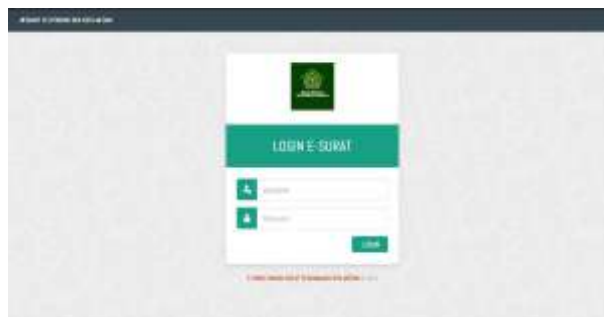
Gambar 3 Tampilan Login

Sebelum masuk kedalam tampilan beranda, akan muncul tampilan login terlebih dahulu. Pada bagian login ini akan membutuhkan username dan password dari masing-masing pengguna.