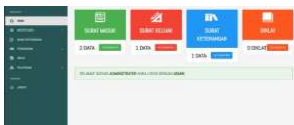
Gambar 5 Tampilan Beranda Admin

Gambar 1.5 tampilan dari beranda admin yang akan terlihat apabila login menggunakan username dan password akun admin.