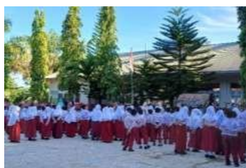
Gambar.1 Kegiatan Siswa

Berdasarkan dari observasi langsung yang pelaksanaannya di kelas V SD Negeri 12 Padang Besi, ditemukan bahwa media pembelajaran yang umumnya digunakan oleh guru masih mengandalkan penggunaan alat peraga fisik seperti kardus dan kertas origami dalam pembelajaran bangun ruang. Dengan demikian, guru juga menggunakan media visual berupa